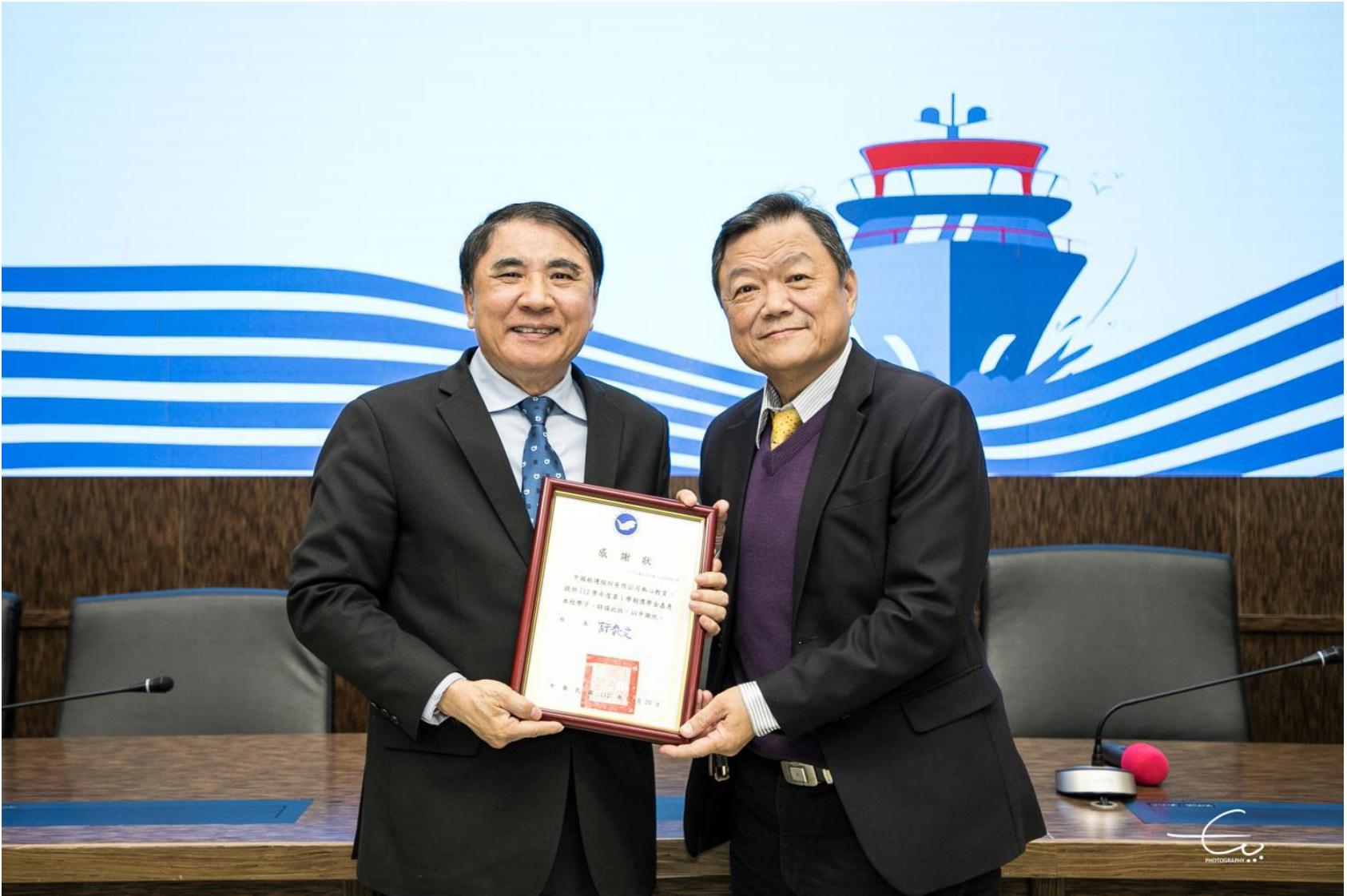
112 年 12 月 20 日海洋大學致贈中航感謝狀