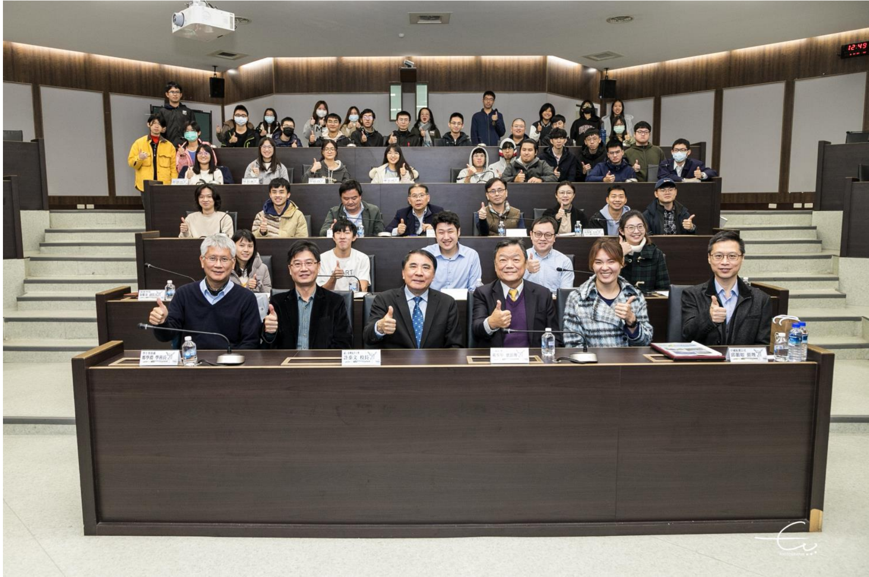
112 年 12 月 20 日中航戴聖堅總經理與國立台灣海洋大學師生座談會會後合照