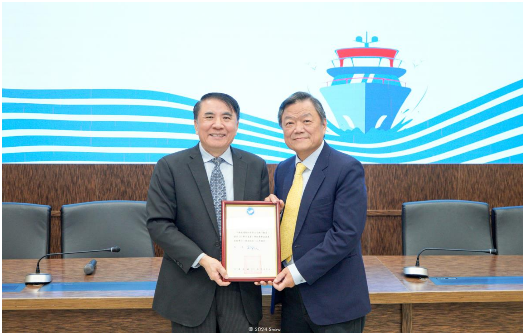
113 年 12 月 9 日海洋大學致贈中航感謝狀