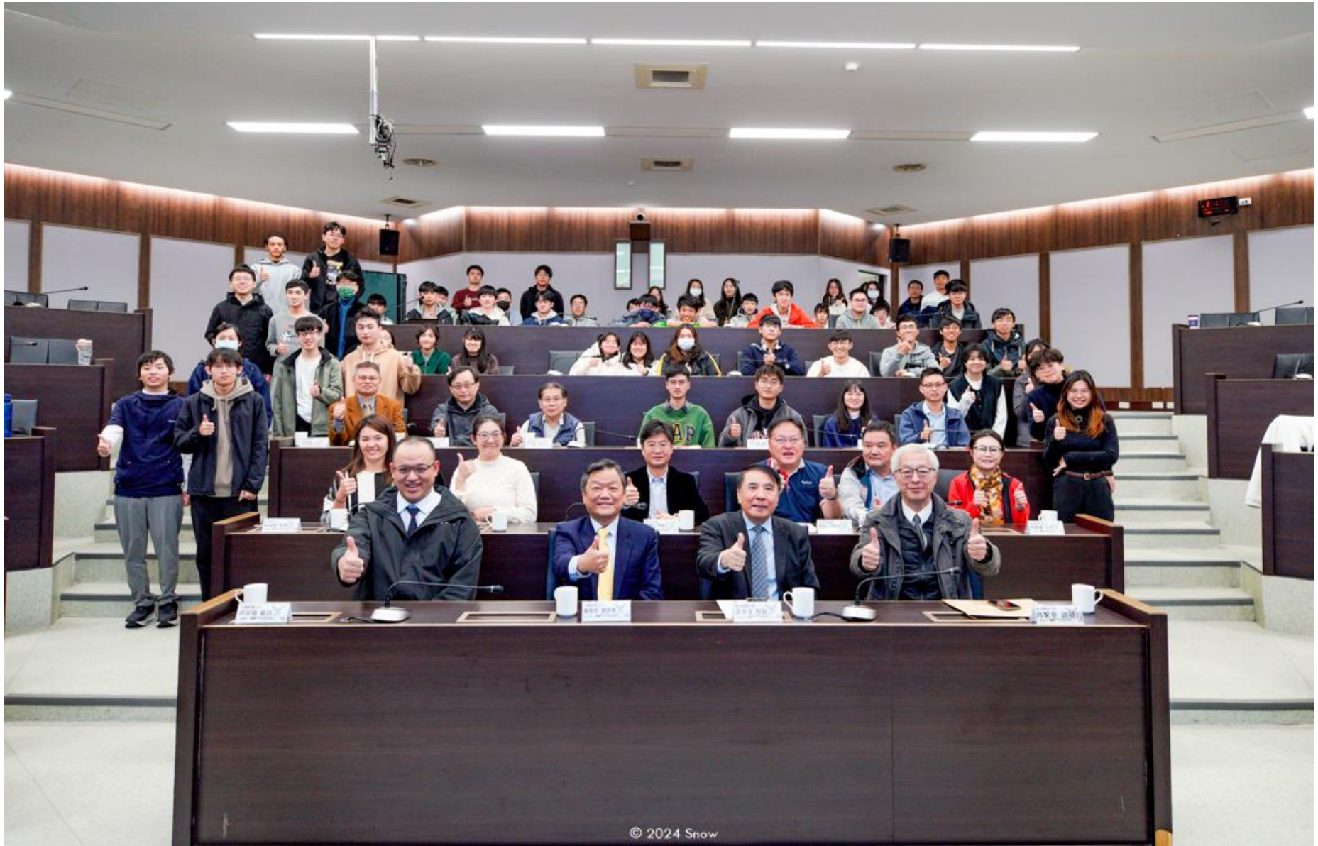
113 年 12 月 9 日中航戴聖堅總經理與國立台灣海洋大學師生座談會會後合照